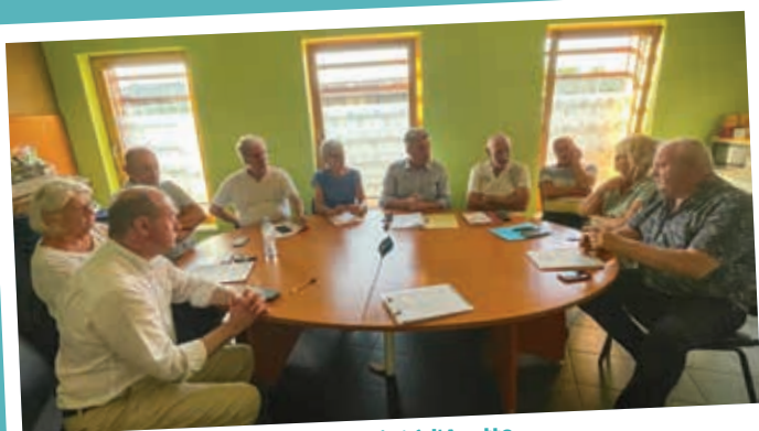
Bureau communautaire décentralisé à l'Ayotte