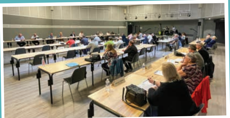
Conseil Communautaire du 25 mai 2023 à Hauconcourt