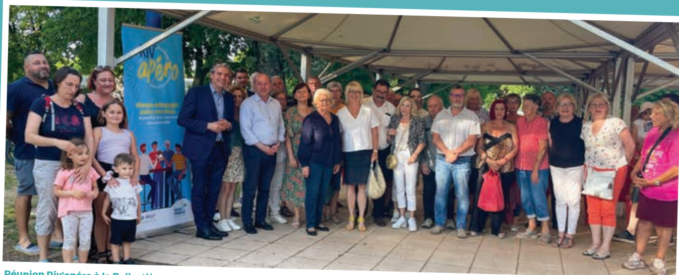
Réunion Riv'apéro à la Ballastière