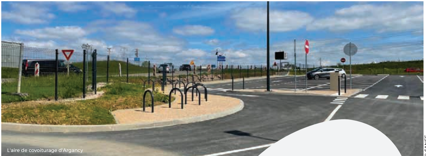
L'aire de covoiturage d'Argancy

Depuis la mise en place de son Plan Climat Air Énergie Territorial en 2021, Rives de Moselle multiplie les actions en faveur du développement durable et, ce au travers de toutes ses compétences. Explications.