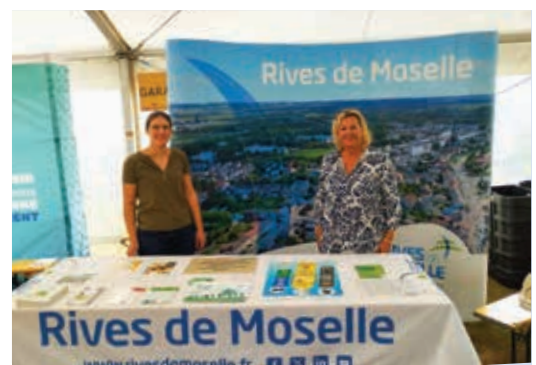
Festival Moselle écologie à Maizières les Metz