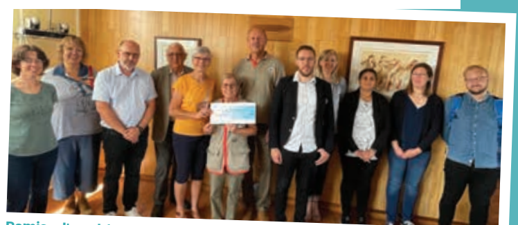
Remise d'un chèque de 3 995 euros à la croix rouge Hagondange