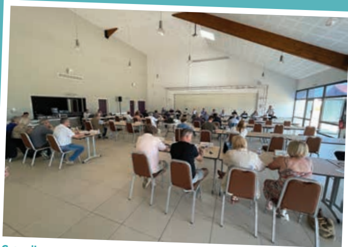
Conseil communautaire à Fèves le 6 juillet 2023