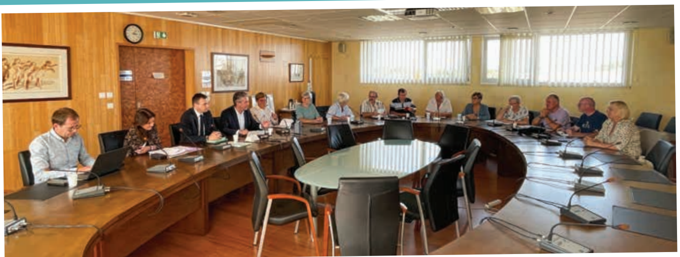
Accueil du Secrétaire Général de la Préfecture de Moselle à l'hotel communautaire