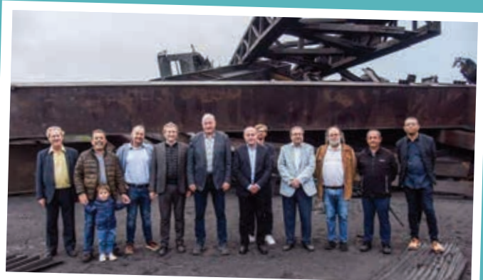
Démolition de l'acierie de Gandrange