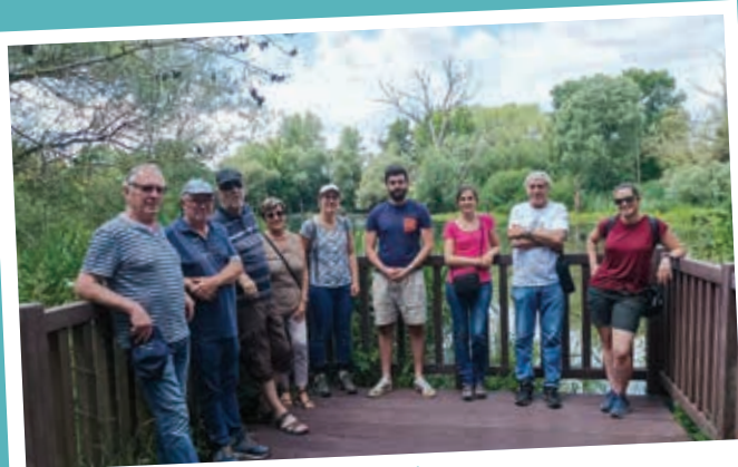
Rencontre nature et environnement à Argancy