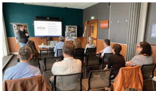
Réunion avec les professionnels de l'hébergement touristique sur le territoire