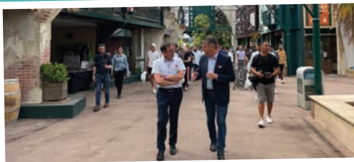
Inauguration d'une nouvelle zone à Walygator