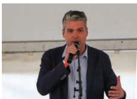
Inauguration pays'an fête