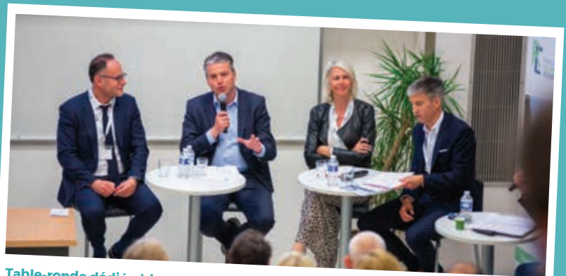
Table-ronde dédiée à la commande publique et le développement durable organisée par la chaire RENEL (Ressources Naturelles et Economie Locale).