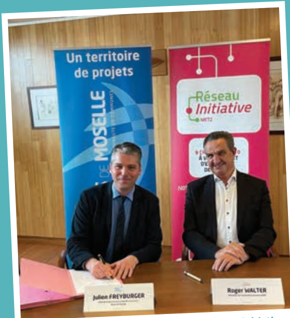
Renouvellement de convention avec le réseau initiative Metz

L'actualité est perpétuelle sur le territoire. Voici quelques évènements marquants de ces derniers mois.