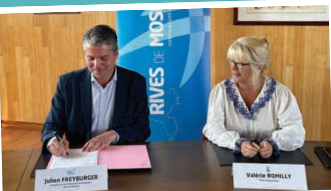
Signature d'une convention de transfert de gestion des chaufferies du centre aquatique Aquarives Hagondange dans le cadre de la réalisation du chauffage urbain.