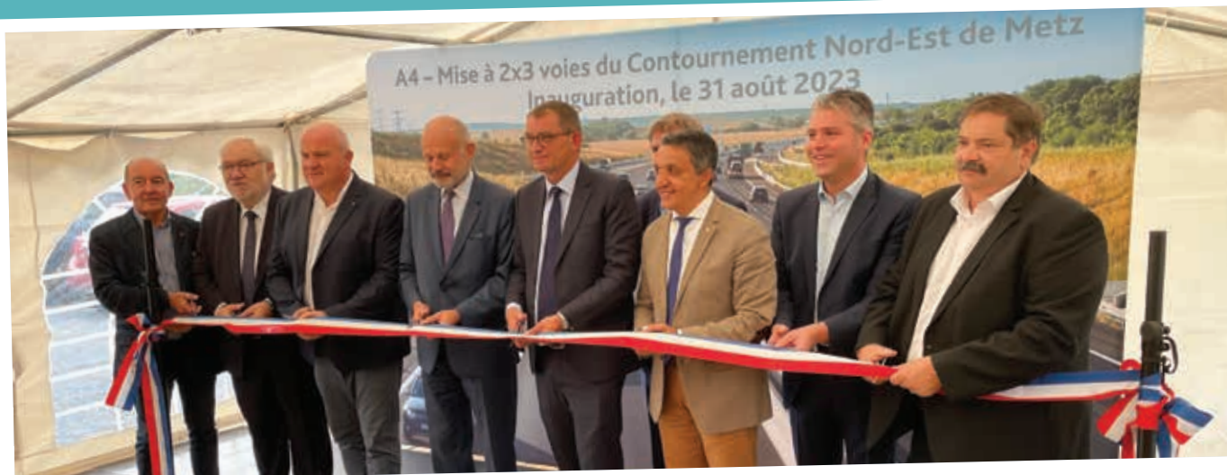
Inauguration de la mise à 2x3 voies de l'A4 à Hauconcourt.