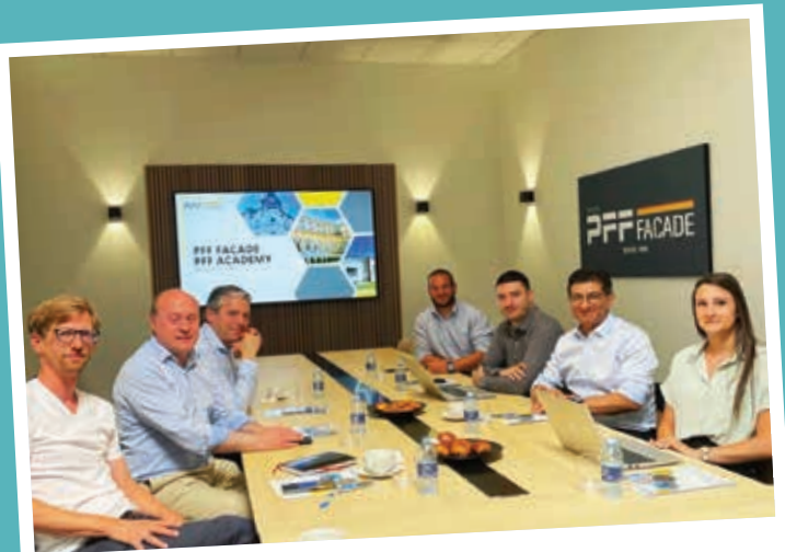
Visite de l'entreprise PFF Façade