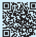
App Store & Play Store

Plus de problème de correspondance et moins de stress ! Avouez que c'est pratique !