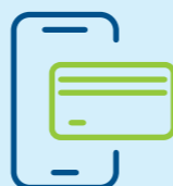
Accès à la billettique